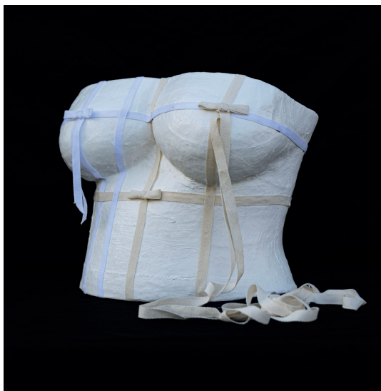
Buste de femme engagée dans la lutte contre le cancer

Confectionnés à partir de moulage en plâtre, les bustes Keep A Breast sont ensuite peints par des artistes contemporains pour sensibiliser un public large aux 4 coins du monde.